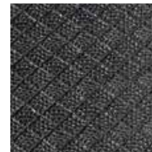
Rautenprofil mit Deckschicht