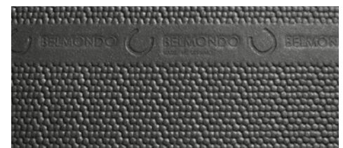
bewährtes Hammerschlagprofil an der Oberseite