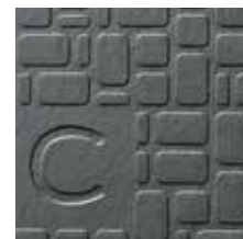
Mosaikdesign mit Deckschicht