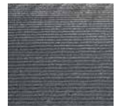
stabiles Rillenprofil an der Unterseite

Sonderabmessungen sind grundsätzlich auf Anfrage möglich. Alle BELMONDO® Produkte sind sowohl für den Boxenstall als auch für den Laufstall geeignet.